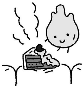
食べたものの消化を助ける