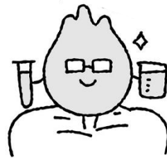
歯をとげにくくする