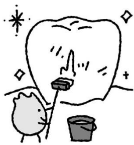
歯についた食べかすを洗い流す